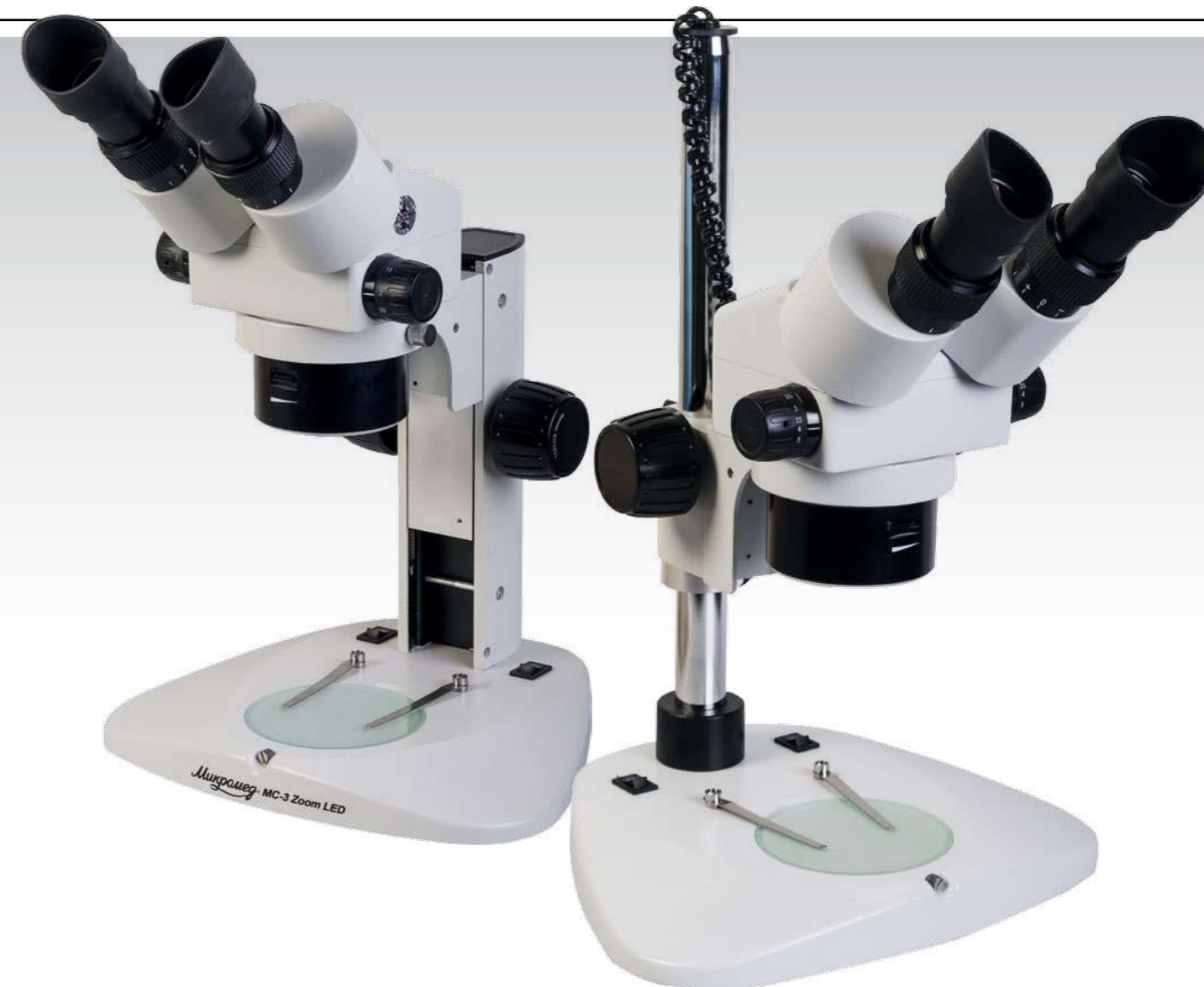
Микромед MC-3-ZOOM LED