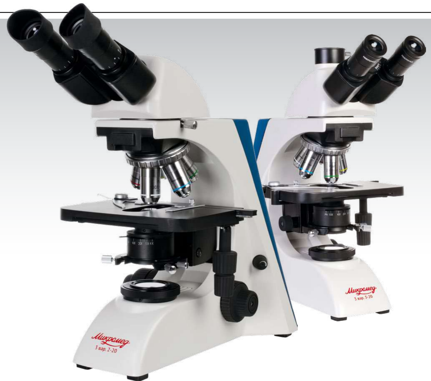
Микромед 3 вар. 2-20М

* поставляется по дополнительному заказу