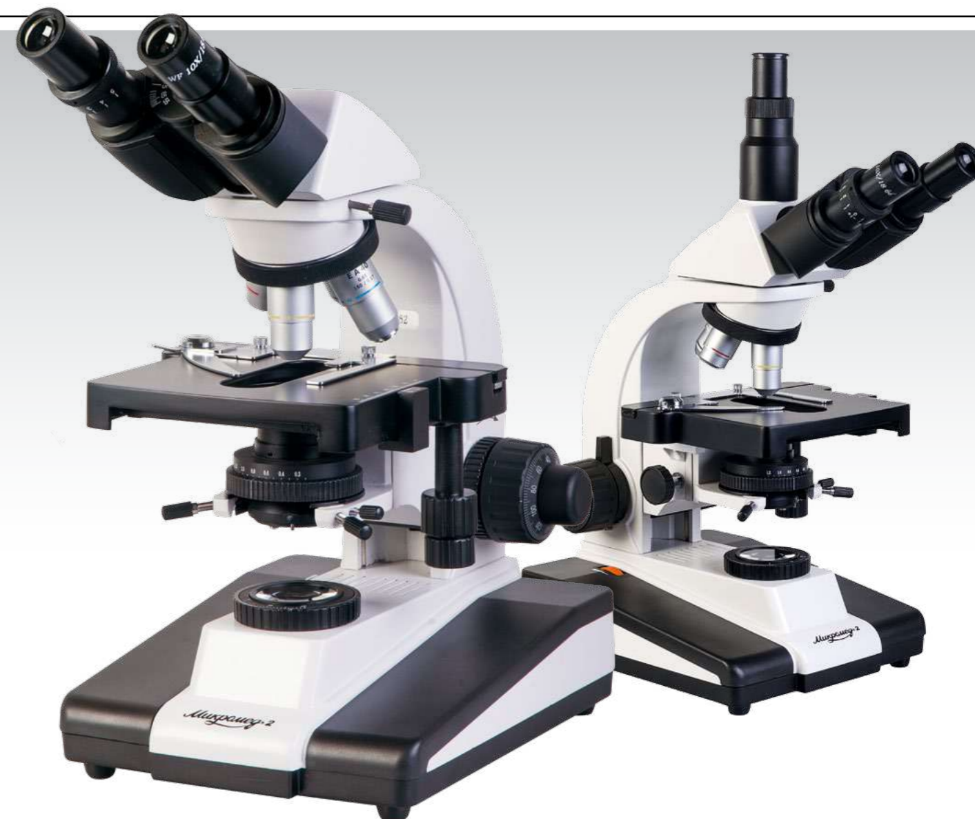
Микромед 2 вар. 2-20