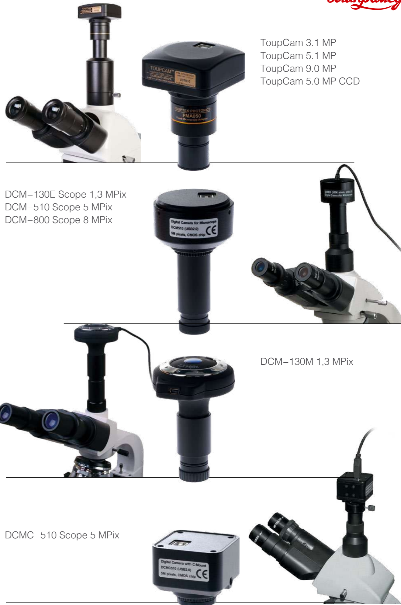
ToupCam 3.1 MP ToupCam 5.1 MP ToupCam 9.0 MP ToupCam 5.0 MP CCD