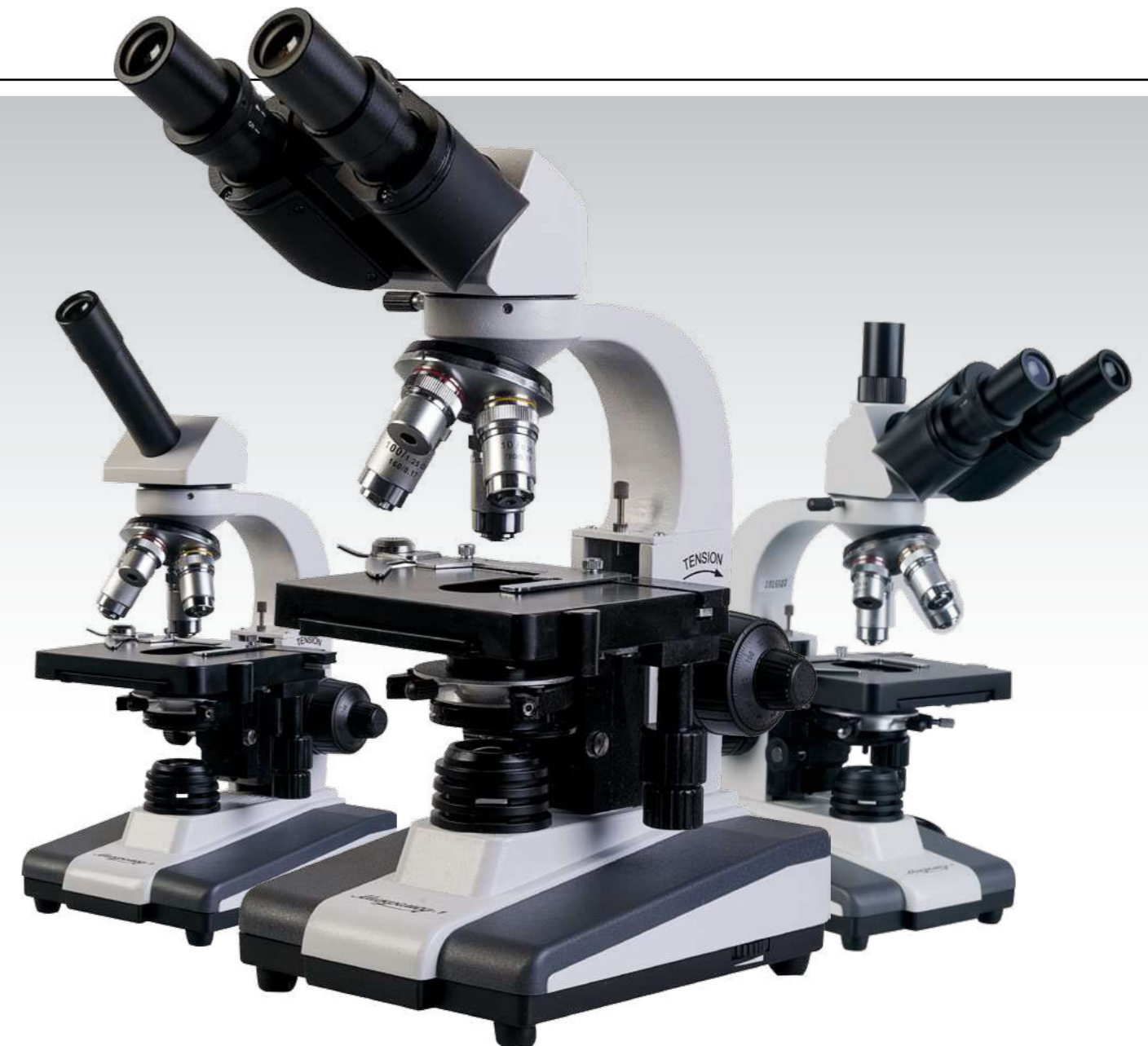
Микромед 1 вар. 1-20