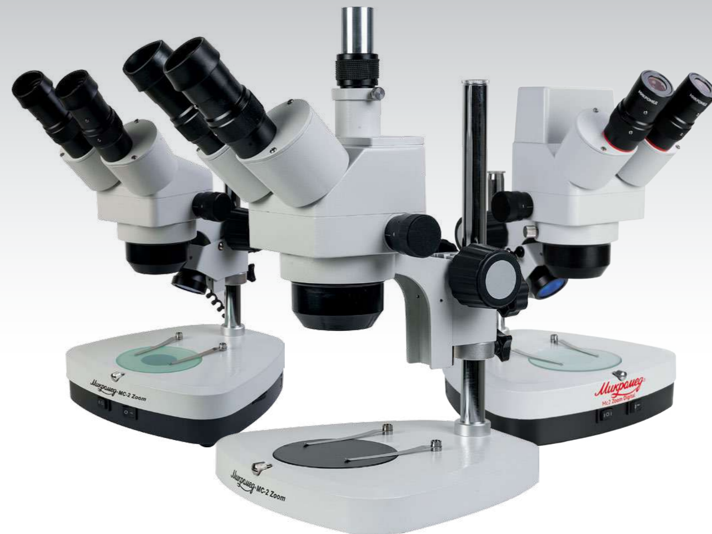
MC-2-ZOOM вар. 1 CR