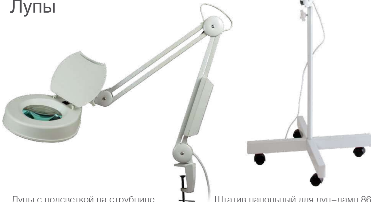
Лупы с подсветкой на струбцине