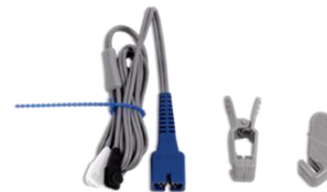
Ветеринарный датчик SpO2