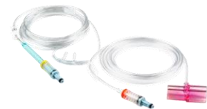
Линия отбора проб CO2