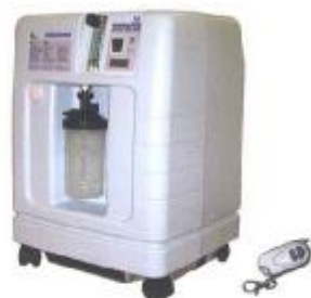
Корпус кислородного концентратора Atmung 3L-I с дистанционным пультом управления (Пульт может не входить в комплект поставки, уточняйте его наличие у поставщика)