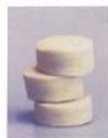
Воздушный фильтр Atmung 5L-I