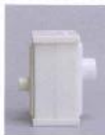
Воздушный фильтр Atmung 3L-I