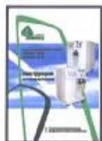
Инструкция по эксплуатации