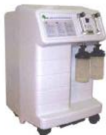
Корпус кислородного концентратора Atmung 5L-I