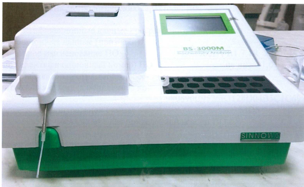
Рисунок 1 - Общий вид анализатора полуавтоматического биохимического BS-3000M

Схема пломбировки от несанкционированного доступа, обозначение места нанесения знака поверки представлены на рисунке 2.