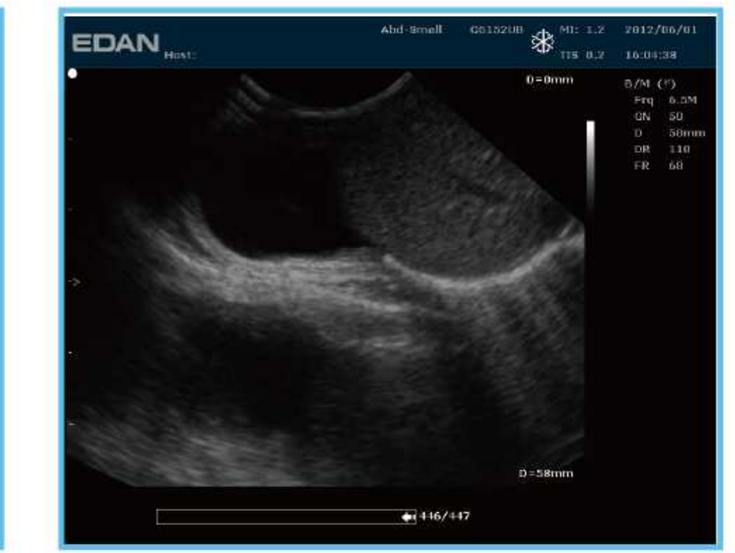
Подпеченочный выпот кошки