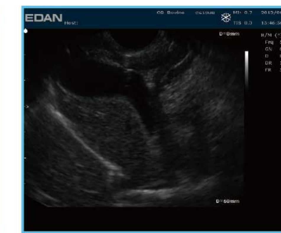
Желчный пузырь собаки